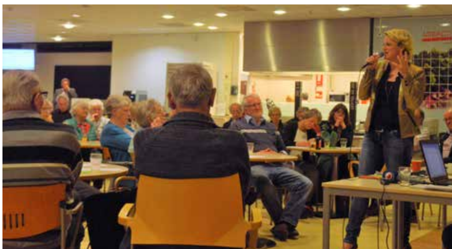
Afke boven docht har ferhaal